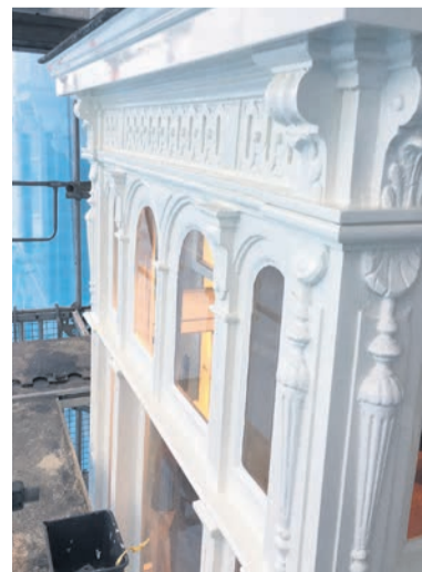
Na deze grondige aanpak moet de gevel er weer tien jaar tegen kunnen

Over de oorzaak van de vele houtrot die Spek en zijn collega’s aantreffen in het honderdvijftig jaar oude pand is niet veel twijfel: ‘Kennelijk is er niet op een grondige en zorgvuldige manier gewerkt, zoals wij wel doen: we frezen alle verbindingen open en repareren ze en repareren alle houtrotplekken tegelijk. Waar de vorige schilder wel houtrotreparaties heeft aangebracht gebruikte hij een soort polyester-