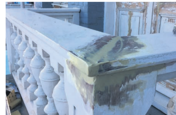
Na zes jaar moest het houtwerk grotendeels kaal gehaald worden en groot-schalig gerepareerd

Epoxy-reparatiemiddel is een betrouwbaarder product dan polyesterplamuur