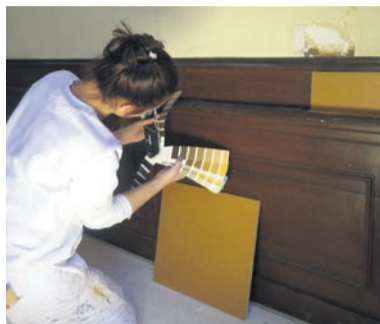
De tijd nemen om de juiste kleurtinten te bepalen