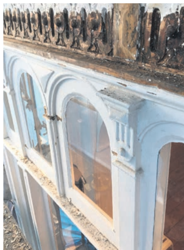
Bij het kaalhalen bleek de ondergrond op veel plaatsen aangetast

Over dat ‘een vak beheersen’: het is Spek zelf die de grotere deelvervangingen, waarvan er in dit project heel wat zaten, uitvoert. ‘Dat heb ik gelukkig mezelf alweer een tijdje geleden geleerd. Als je in deze tijd daarvoor een timmerman nodig zou hebben, kan je lang wachten.