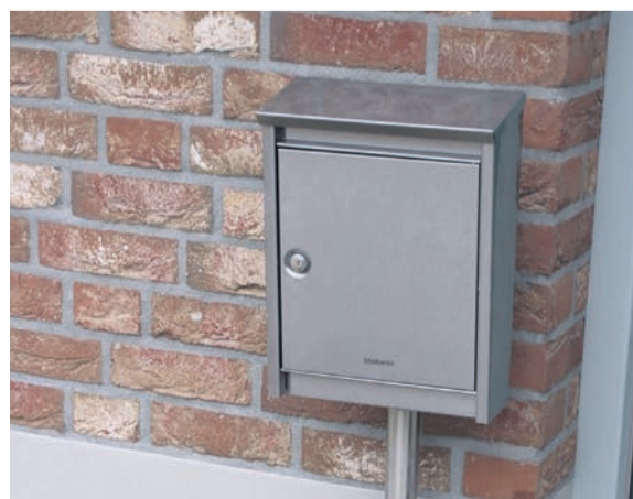
De brievenbus zit niet in de deur. Zo wordt een luchtlek voorkomen.