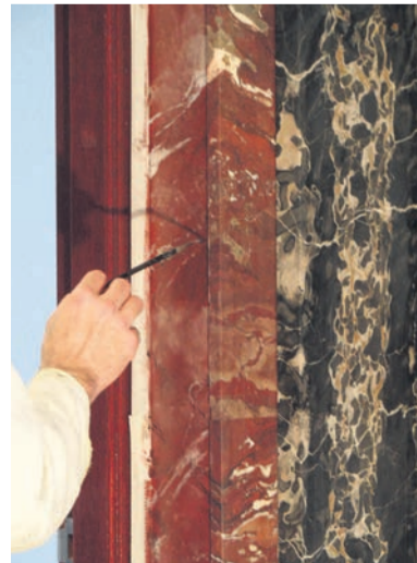
De composities van marmersoorten (her)kennen en weergeven

een kleurentrap in het zicht als historisch document. Belangrijk is wel om alles goed te documenteren van wat onderzocht en gevonden is, en ervoor te zorgen dat aanpassingen zoveel als mogelijk reversibel zijn.'