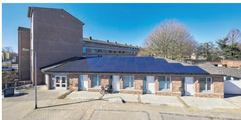
De vier woningen zijn allemaal gasloos en nul-op-de-meter. Ze worden alle vier op een andere manier van warmte en warm water voorzien.