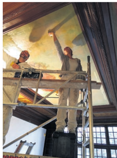
Tegenwoordig begeleidt Ewout Langenberg stagiair(e)s

In een ander pand kwam Langenberg op de draagbalken schilderingen in empirestijl tegen, maar er waren ook sporen van eerdere kleurperiodes te vinden. En oude kraalornamenten en versnijdingen in het hout waren bijna onzichtbaar geworden door een zwaar verfpakket van vele in de loop der tijd aangebrachte verflagen. 'Waar kies je dan voor? Door de balk te logen verdwijnt de verfhistorie, maar krijg je wel oude details terug. Wat laat de opdrachtgever prevaleren? De keuzes zijn subjectief. Je doet het eigenlijk nooit goed. Soms laat je