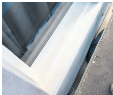
Ondergrond goed behandeld, tot vijf lagen (grond)verf: strak resultaat